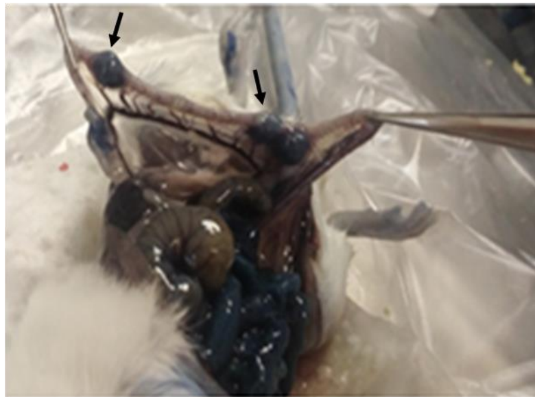
شکل ۱- رنگ‌آمیزی با ایوانس بلو. نقاط برجسته مشخص شده با فلش، رویان‌های لانه‌گزینی شده را نشان می‌دهند.

اثر میزان اکسیژن محیط کشت بر کیفیت بلاستوسیست‌ها با استفاده از روش رنگ‌آمیزی افتراقی: در بررسی اثر میزان اکسیژن محیط کشت بر کیفیت بلاستوسیست، در مجموع ۷۷ بلاستوسیست، حاصل از کشت رویان‌های دوسلولی در شرایط ذکر